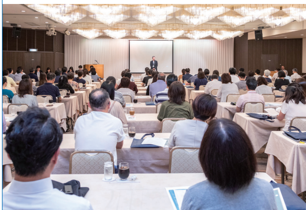
2019年開催時の写真です。今年は会場内感染症対策を行い開催いたします。

開催時間 午前開催 10:00～13:00 午後開催 13:00～16:00 仙台地区のみ9:20～13:00開催